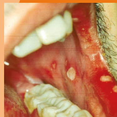
Klinische Bilder einer akuten HIV-Infektion (Exanthem)