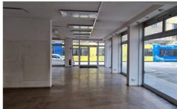
Blick aus dem Mietobjekt Richtung Eingang Taborstraße