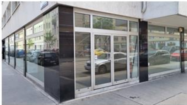
Ecke Darwingasse 2 – Taborstraße 62